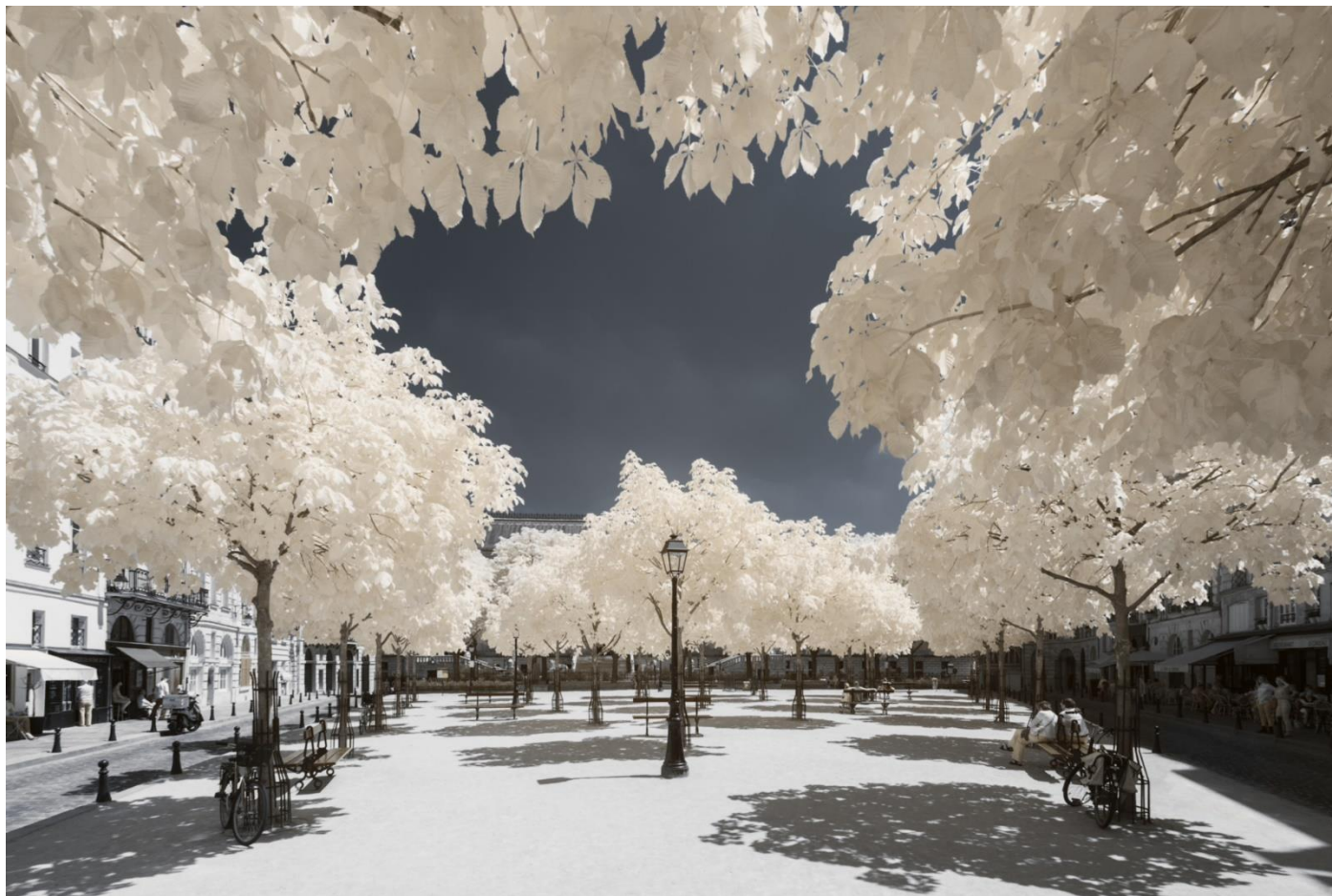
#7 Photographie contrecollée sur Dibond Edition 1/12 40 x 60 cm