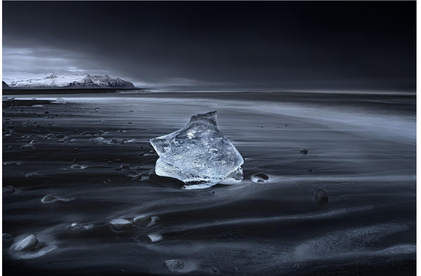
Totem Photographie contrecollée sur Dibond Edition 1/12 80 x 120 cm