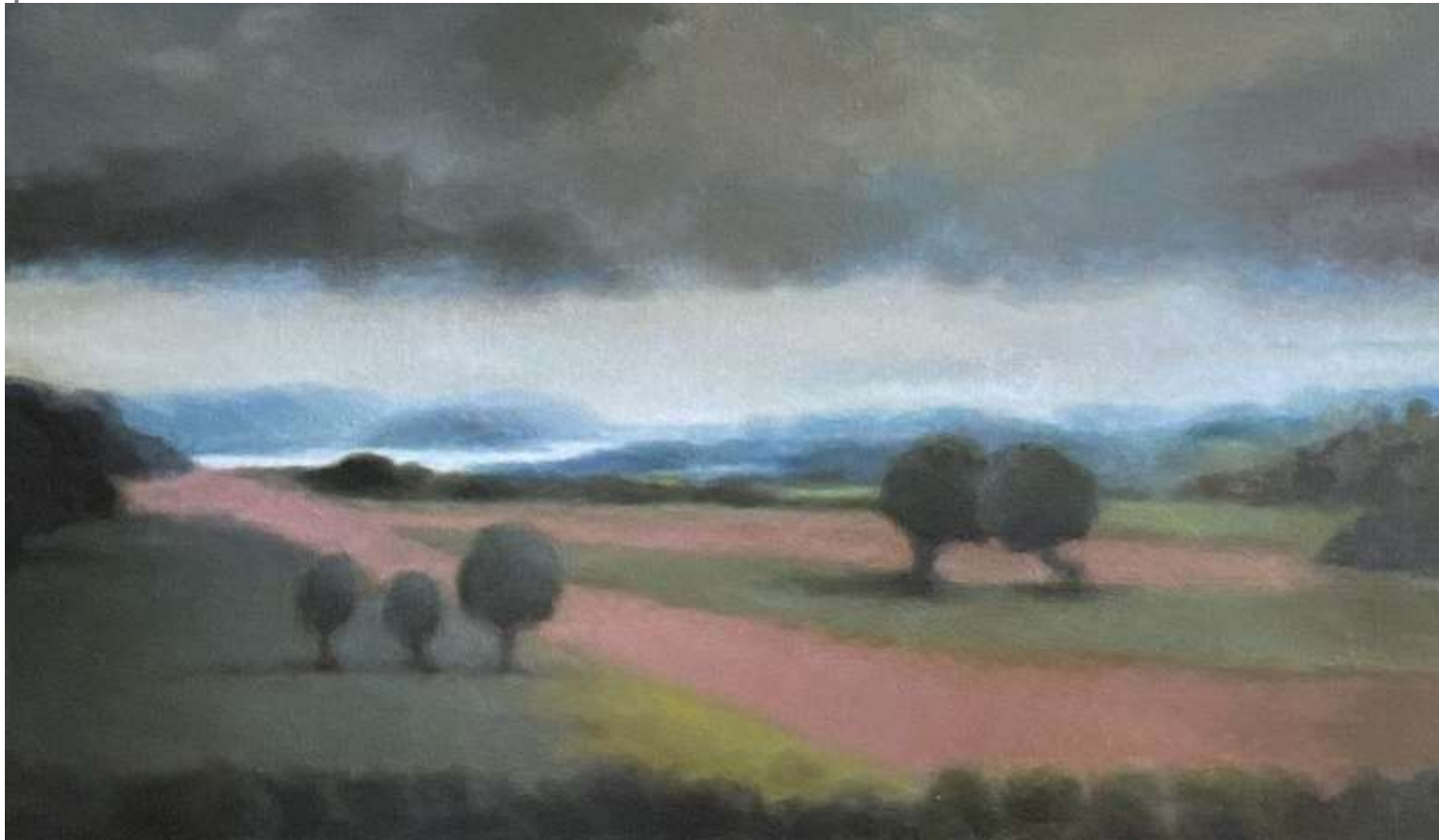
Tendresse, 2021 Huile sur toile 60 x 100 cm 3000 euros