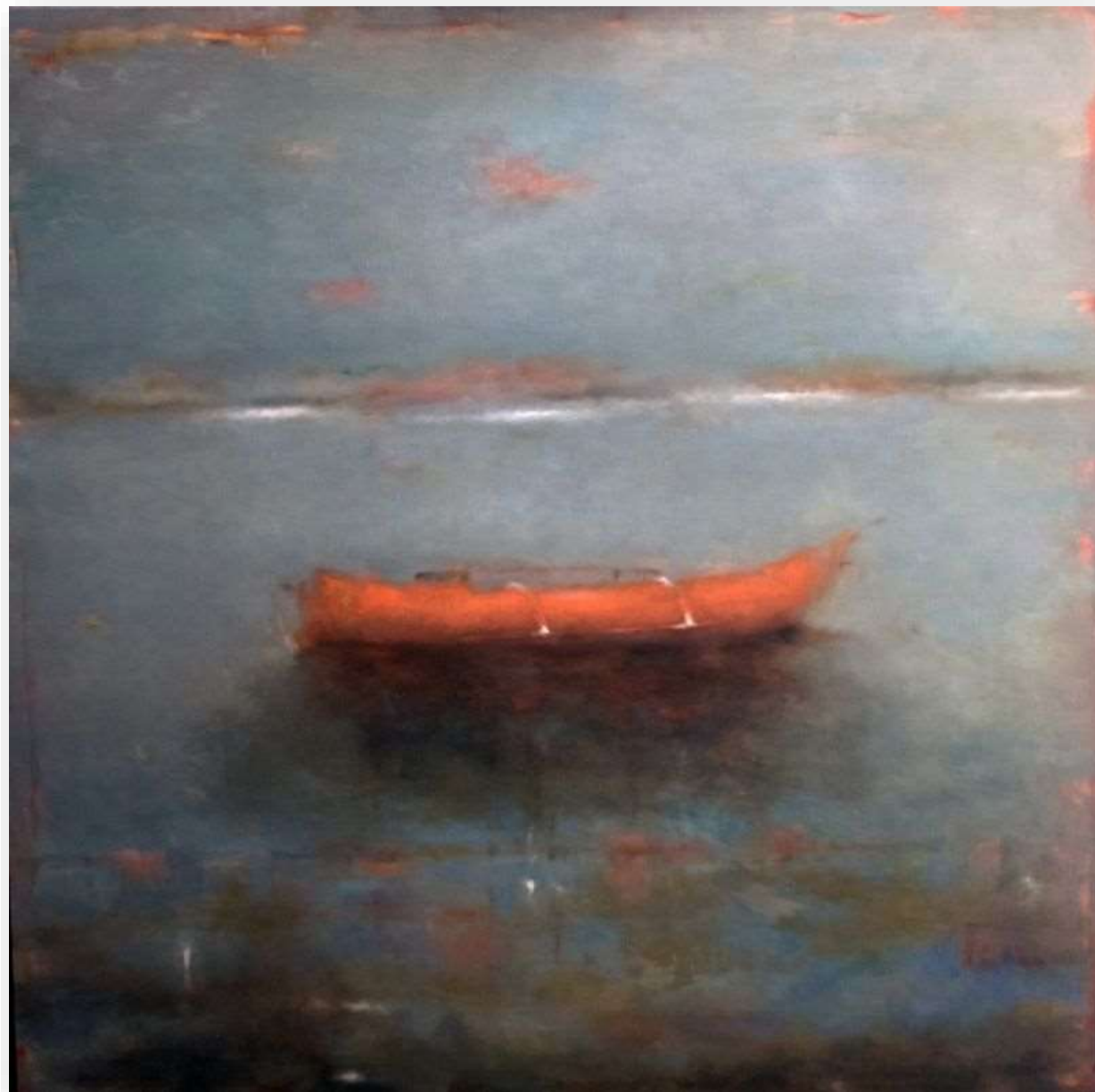
Retour de pêche 3, 2018 Huile sur toile 110 x 110 cm 4000 euros