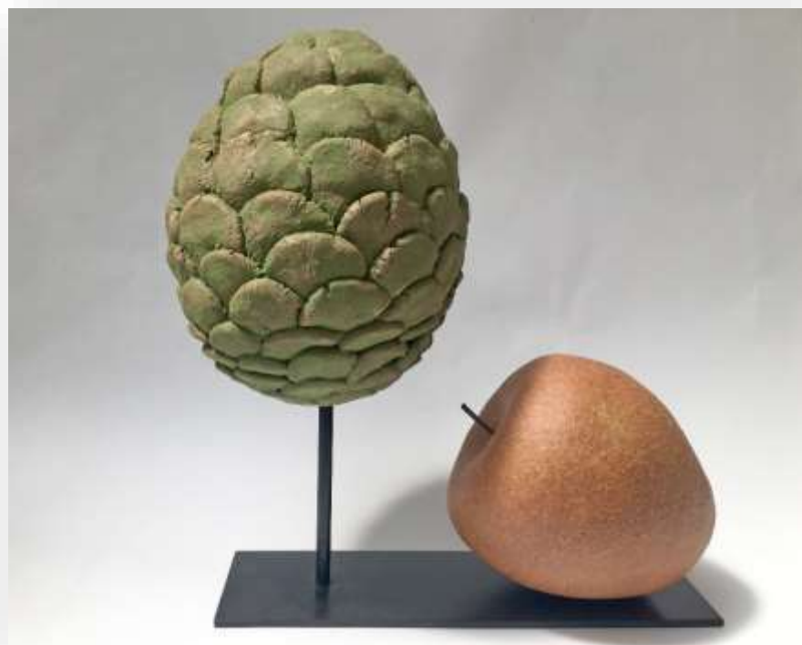
Petit Eden, 2021 Grès chamotté base métal 23 x 22 cm 500 euros