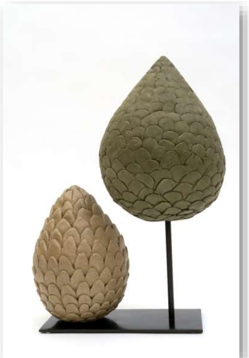
Mimétisme, 2017 Grès chamotté base métal 42 x 36 cm 900 euros