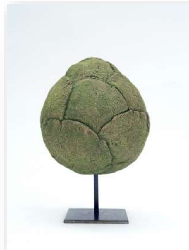
Arbre solo, 2021 Grès chamotté base metal 21 x 14 cm 300 euros