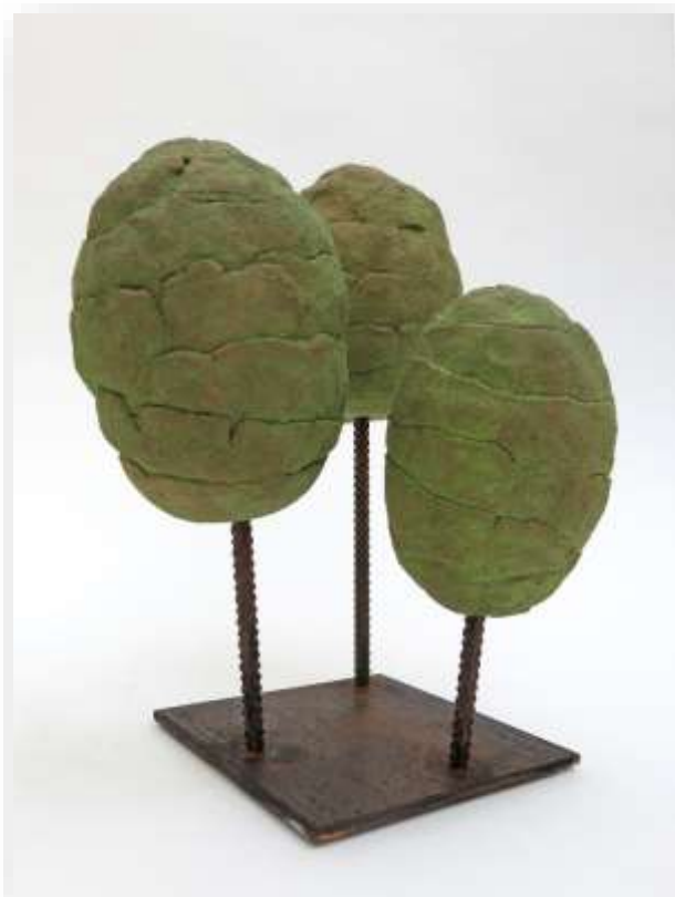
Bouquet d'arbres, 2017 Grès chamotte base métal 500 euros