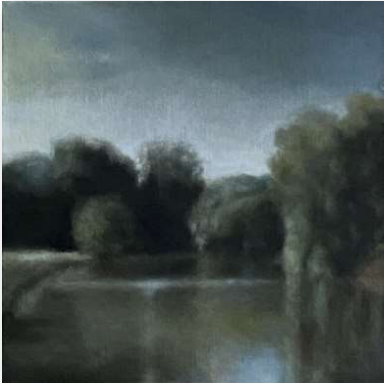
La mare au diable , 2021