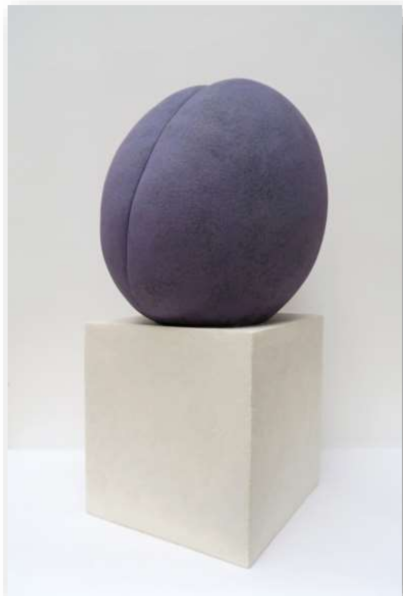
Généreux, 2019 | Grès chamotté | 46 x 30 cm | 950 euros