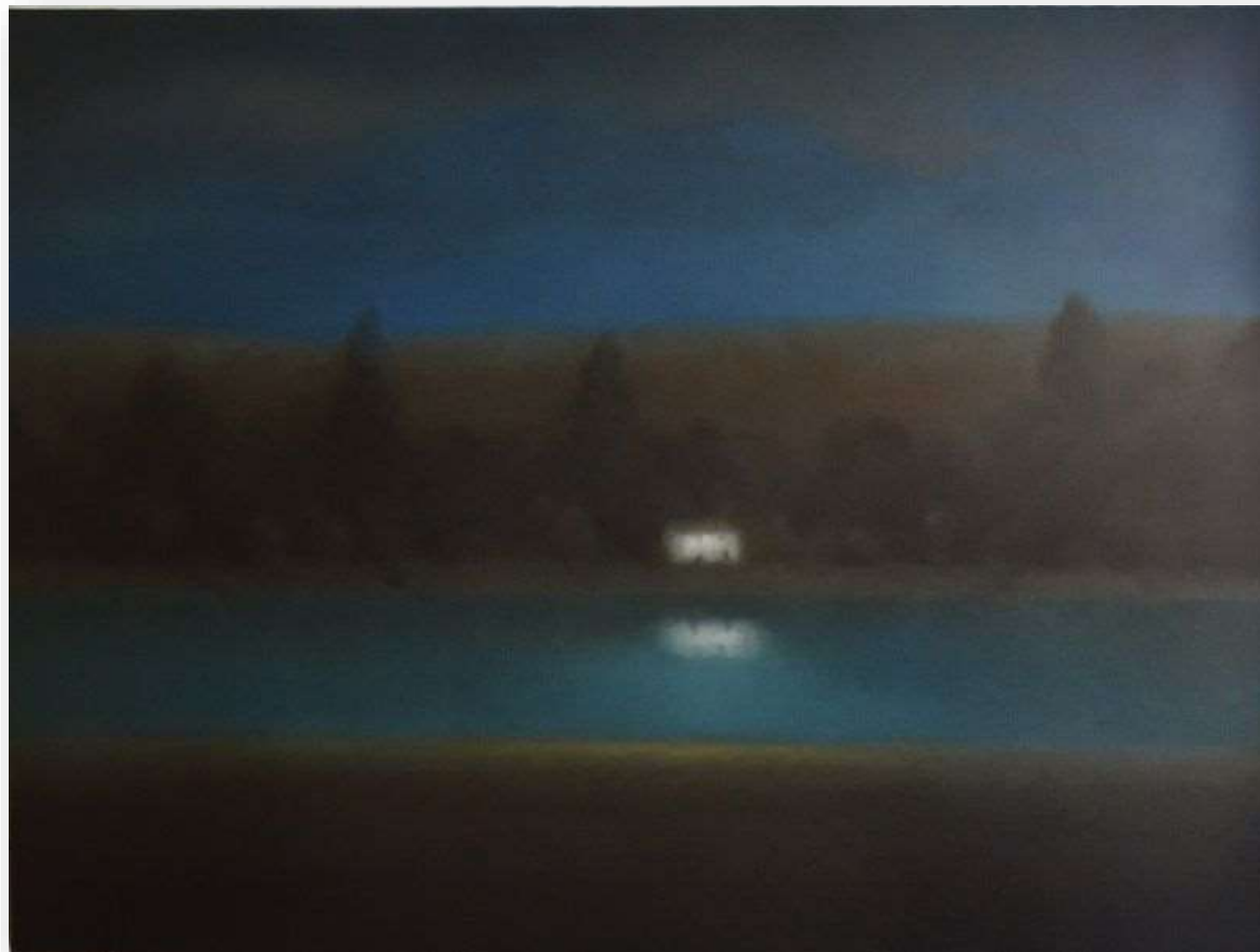
La Maison, 2021 Huile sur toile 97 x 130 cm 4500 euros