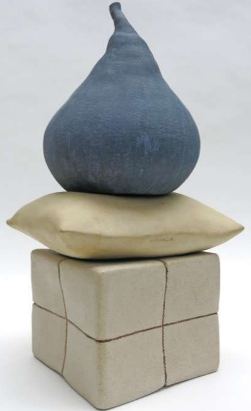
Langueur , 2016 Grès chamotte 62 x 41 cm 1600 euros