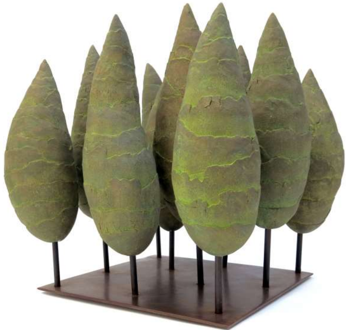
Bosquet, 2015 Grès chamotté base métal 50 x 45 x 43 cm 3200 euros