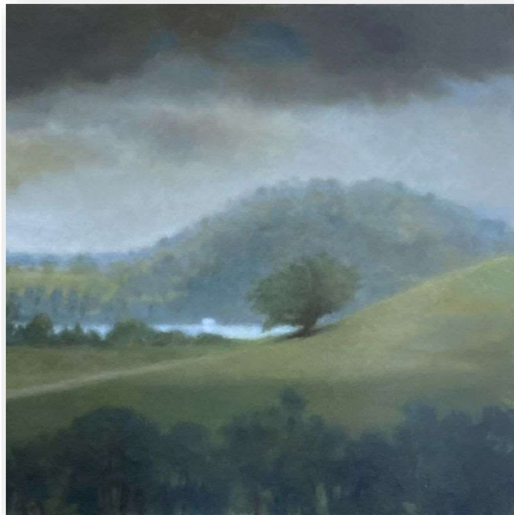
Les Trois Ilets II , 2021 | Huile sur toile | 100 x 100 cm | 3800 euros