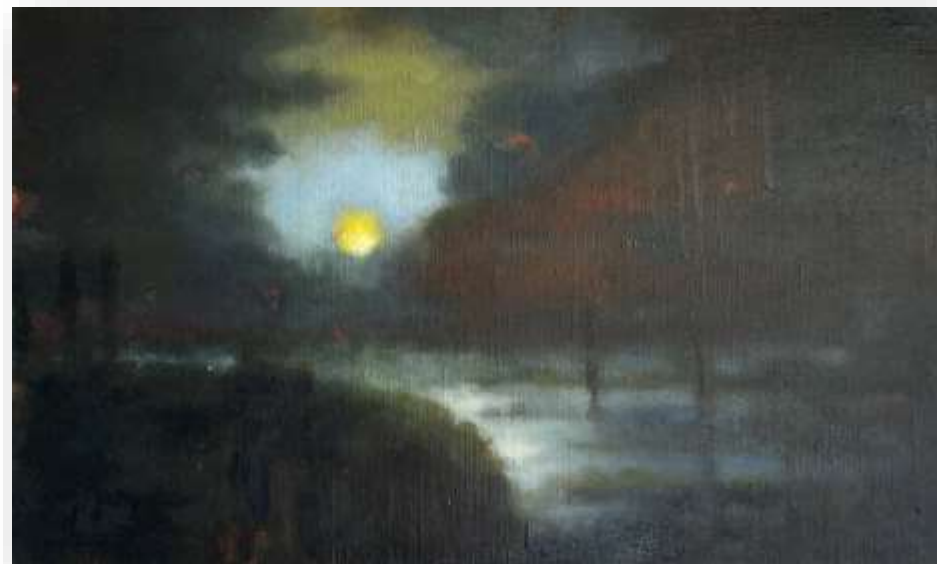
La trouée, 2018 Huile sur toile 30 x 50 cm 1400 euros