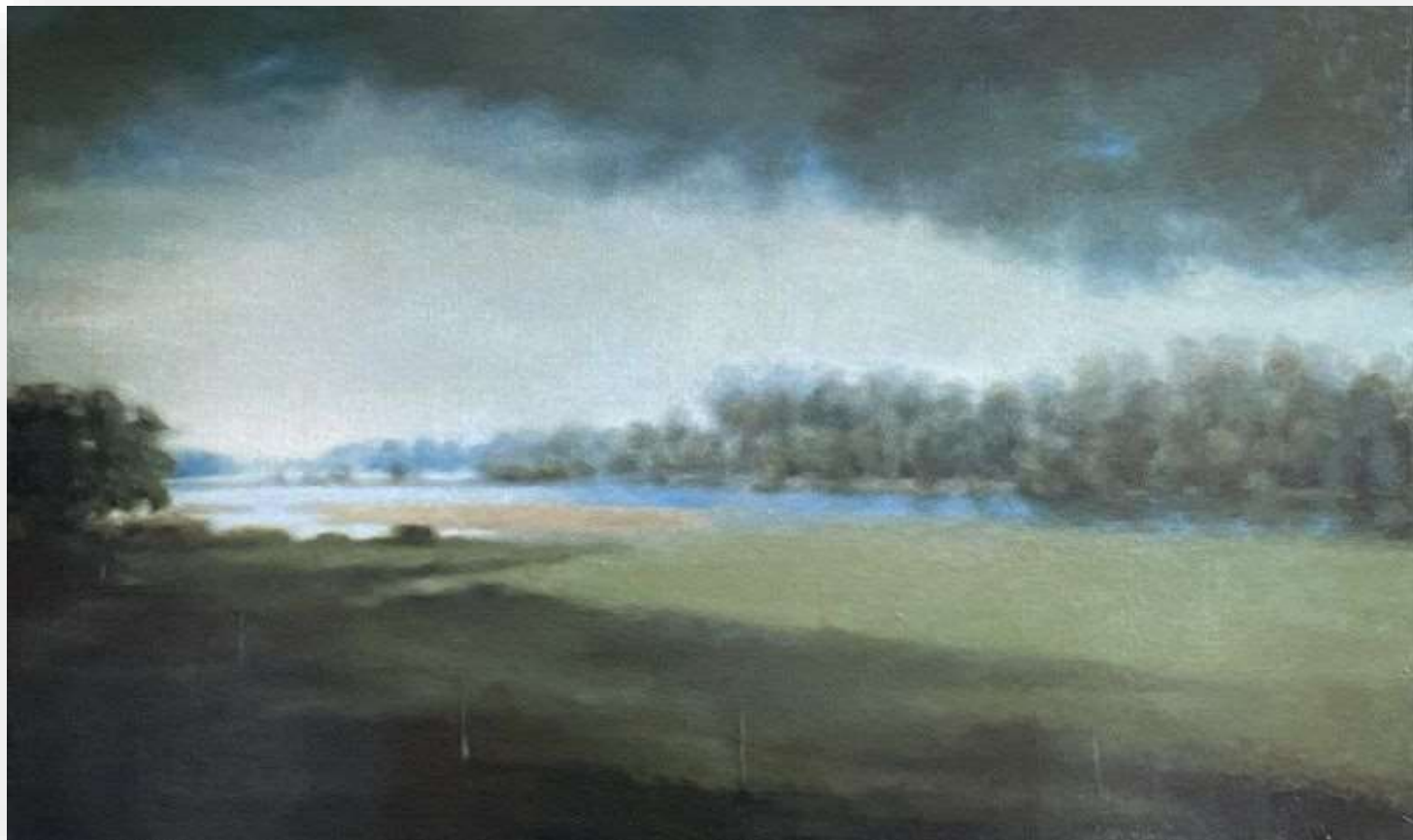
Au bord de la rivière, 2021 Huile sur toile 60 x 100 cm 3000 euros