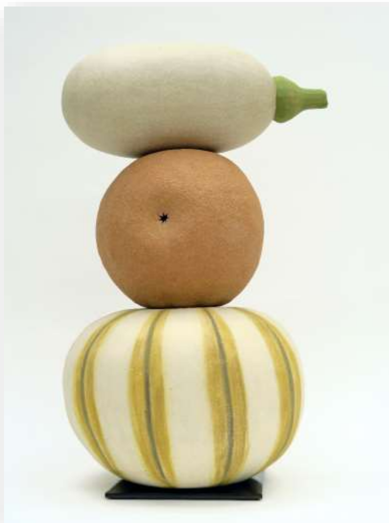
Délicata Pépon, 2021 Grès chamotté 53 x 33 cm 1600 euros