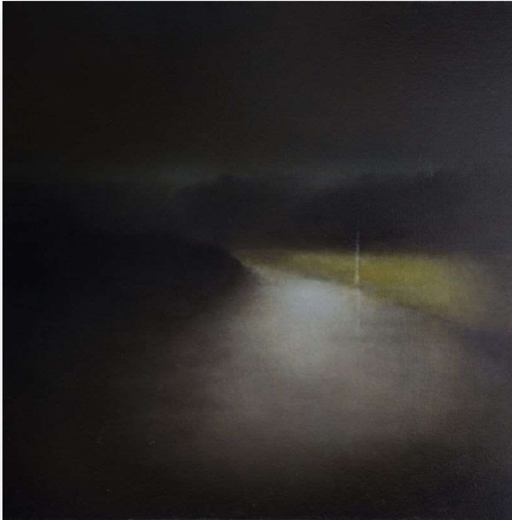
FlashBlack, 2015 Huile sur toile 100 x 100 cm 3800 euros