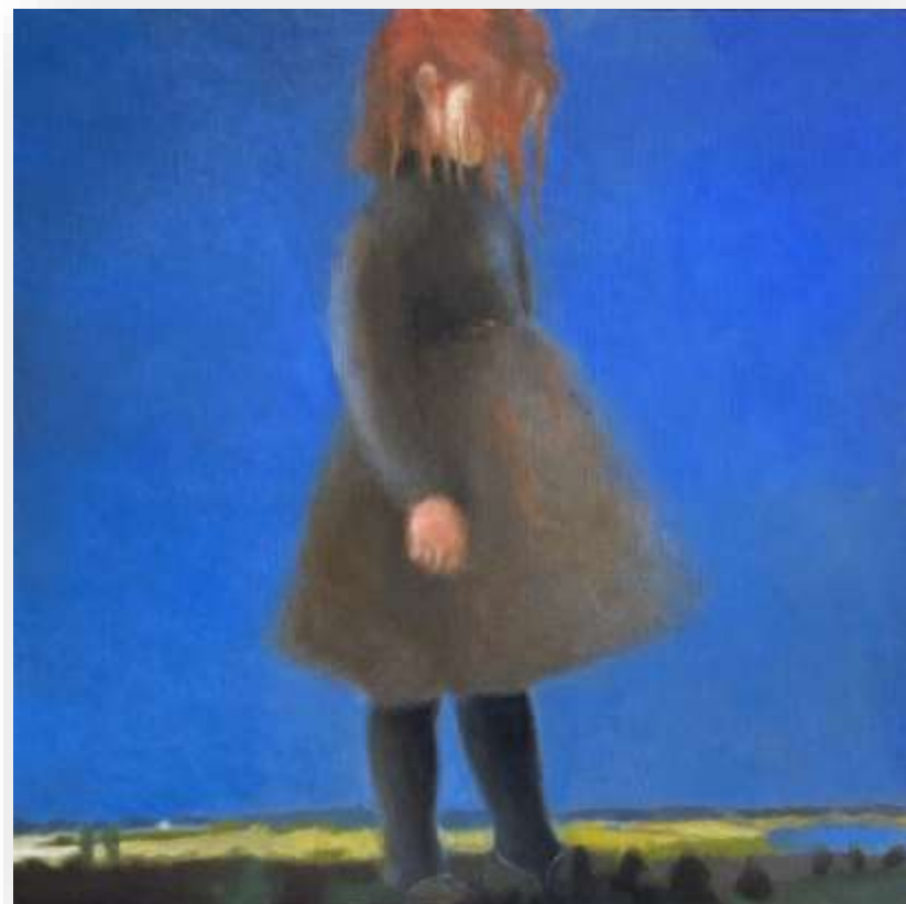
La fille aux cheveux rouges, 2021 Huile sur toile 80 x 80 cm 3000 euros