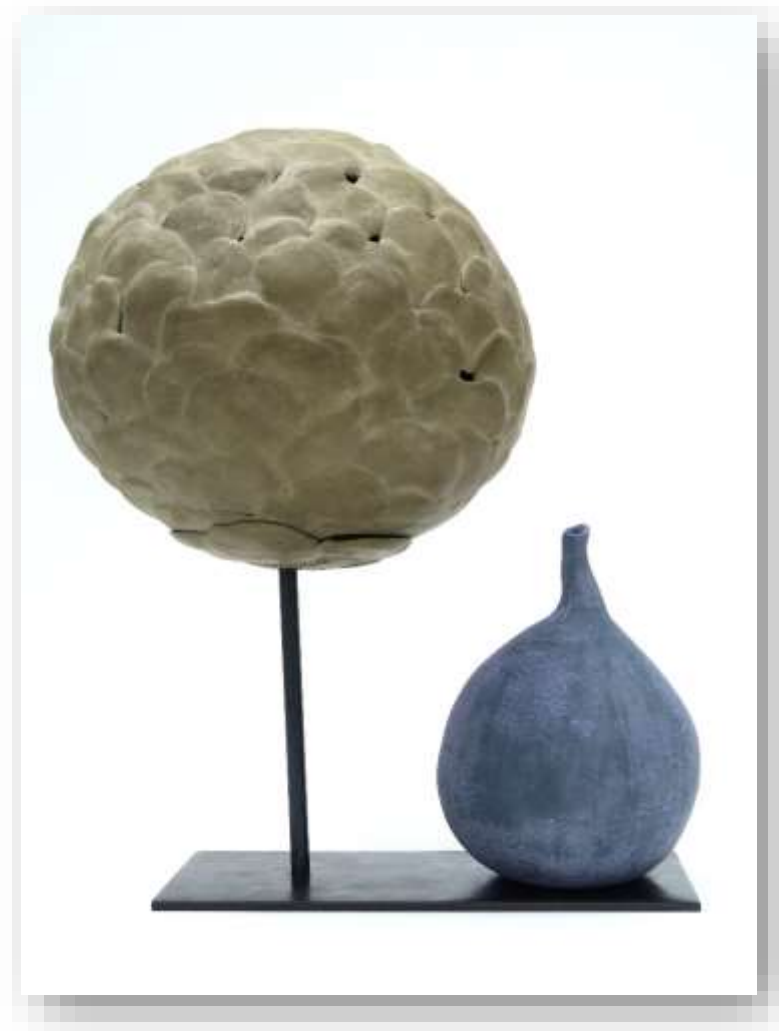
Eden figue, 2020 Grès chamotté base métal 43 x 33 cm 900 euros