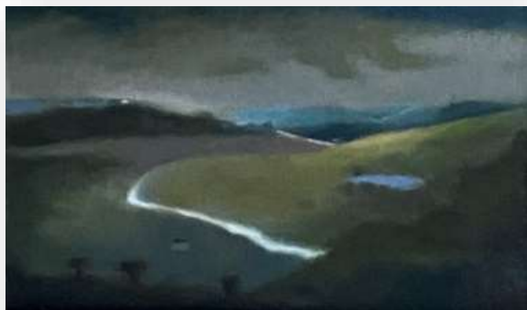
La belle endormie II, 2021 Huile sur toile 27 x 46 cm 950 euros