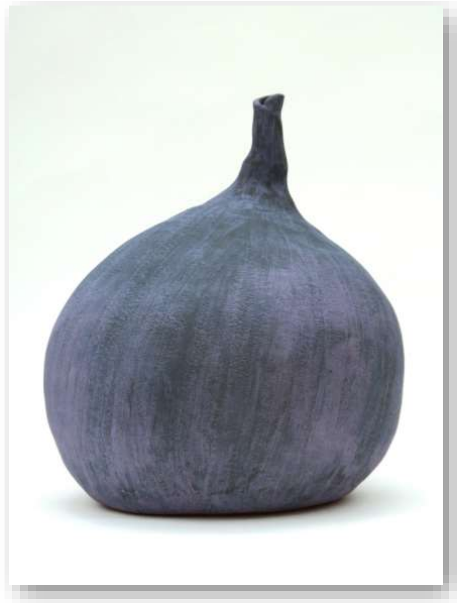
Grande figue, 2021 Grès chamotté 34 x 30 cm 950 euros