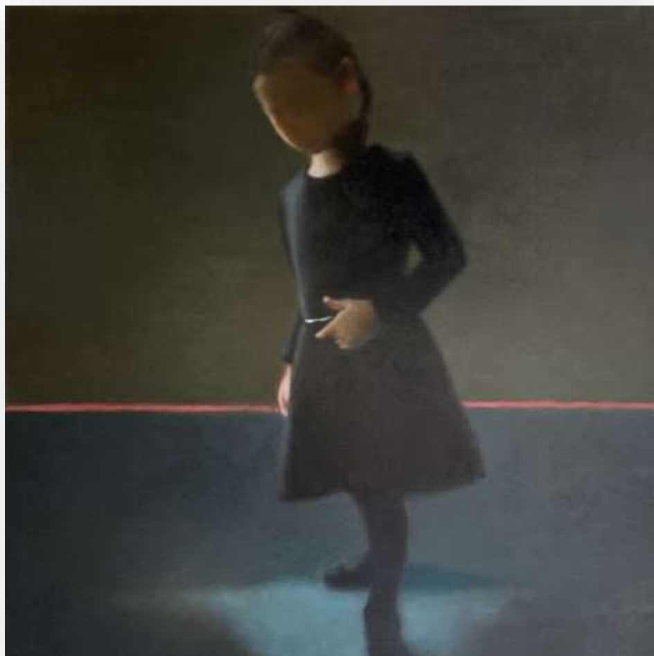
La révérence II, 2021 Huile sur toile 100 x 100 cm 3800 euros