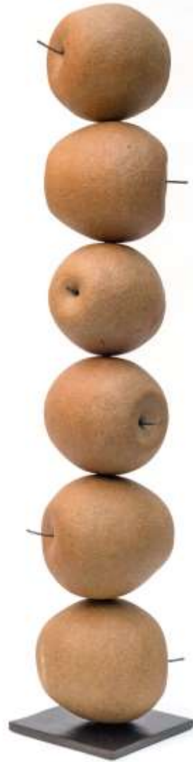
Ribambelle , 2015 Grès chamotté 80 x 20 x 15 cm 1600 euros