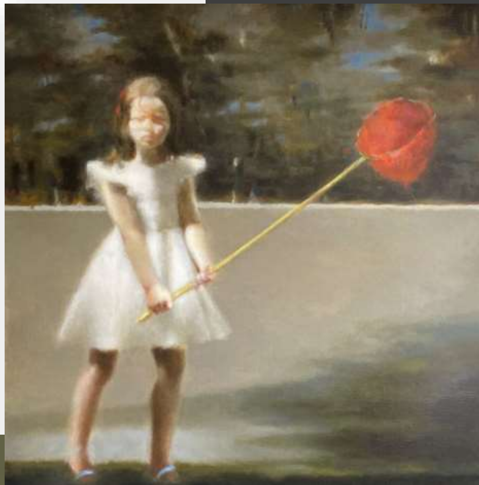
La chasse aux secrets I , 2021 Huile sur toile 110 x 110 cm 4000 euros