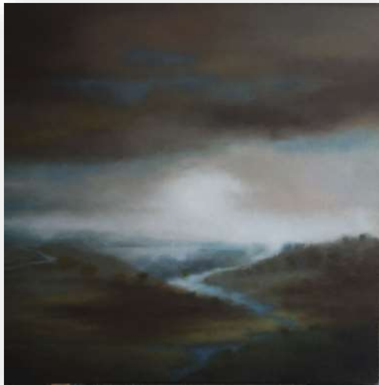
Lumières givrées 1, 2017 Huile sur toile 100 x 100 cm 3800 euros