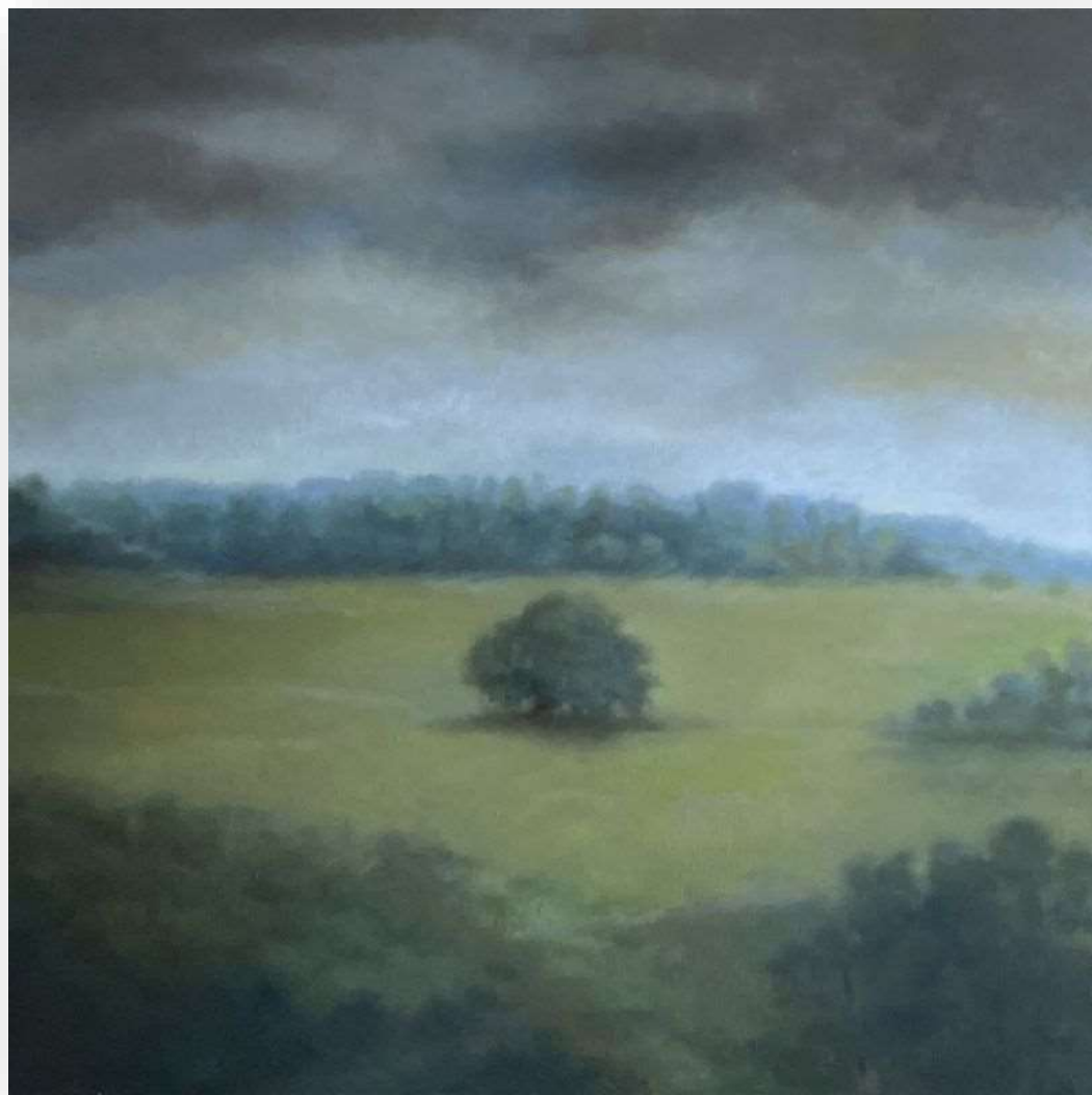
Les Trois Ilets I , 2021 | Huile sur toile | 100 x 100 cm | 3800 euros