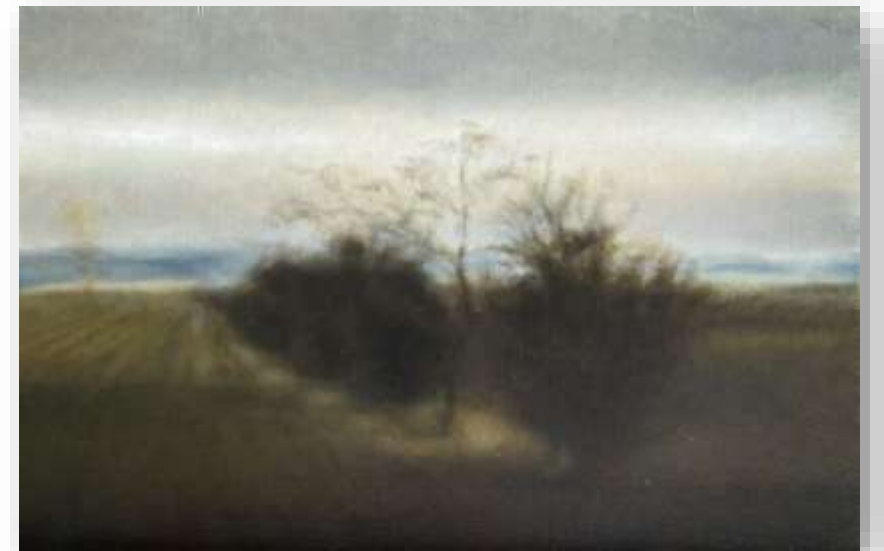
Le labeur, 2021 Huile sur toile 40 x 60 cm 1500 euros