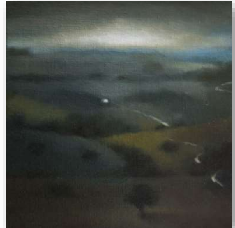
Ballade , 2018