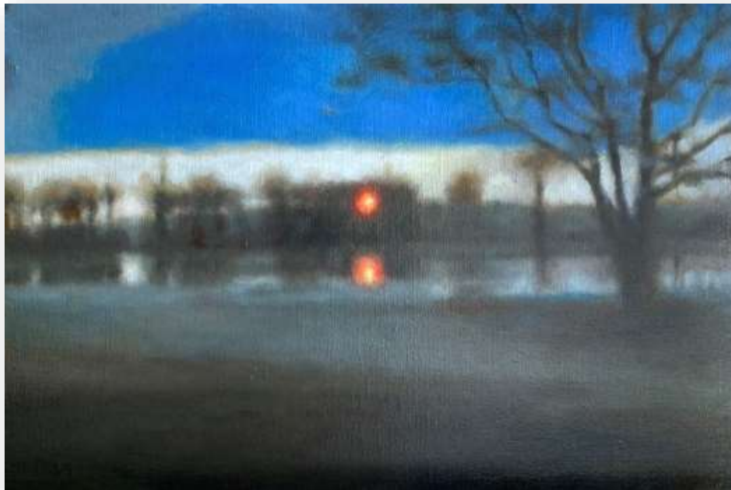
La lune rouge, 2021