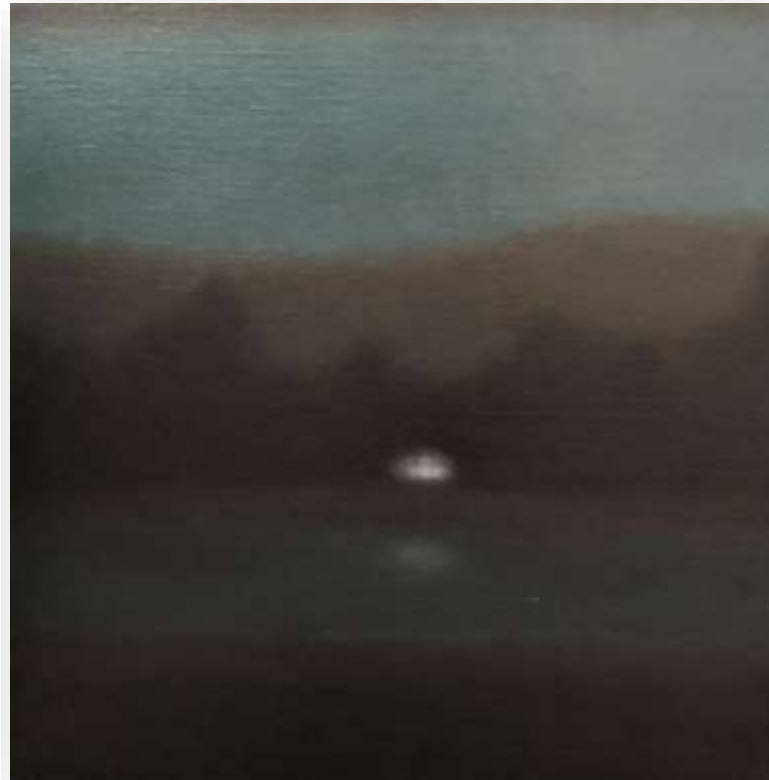
La maison , 2015