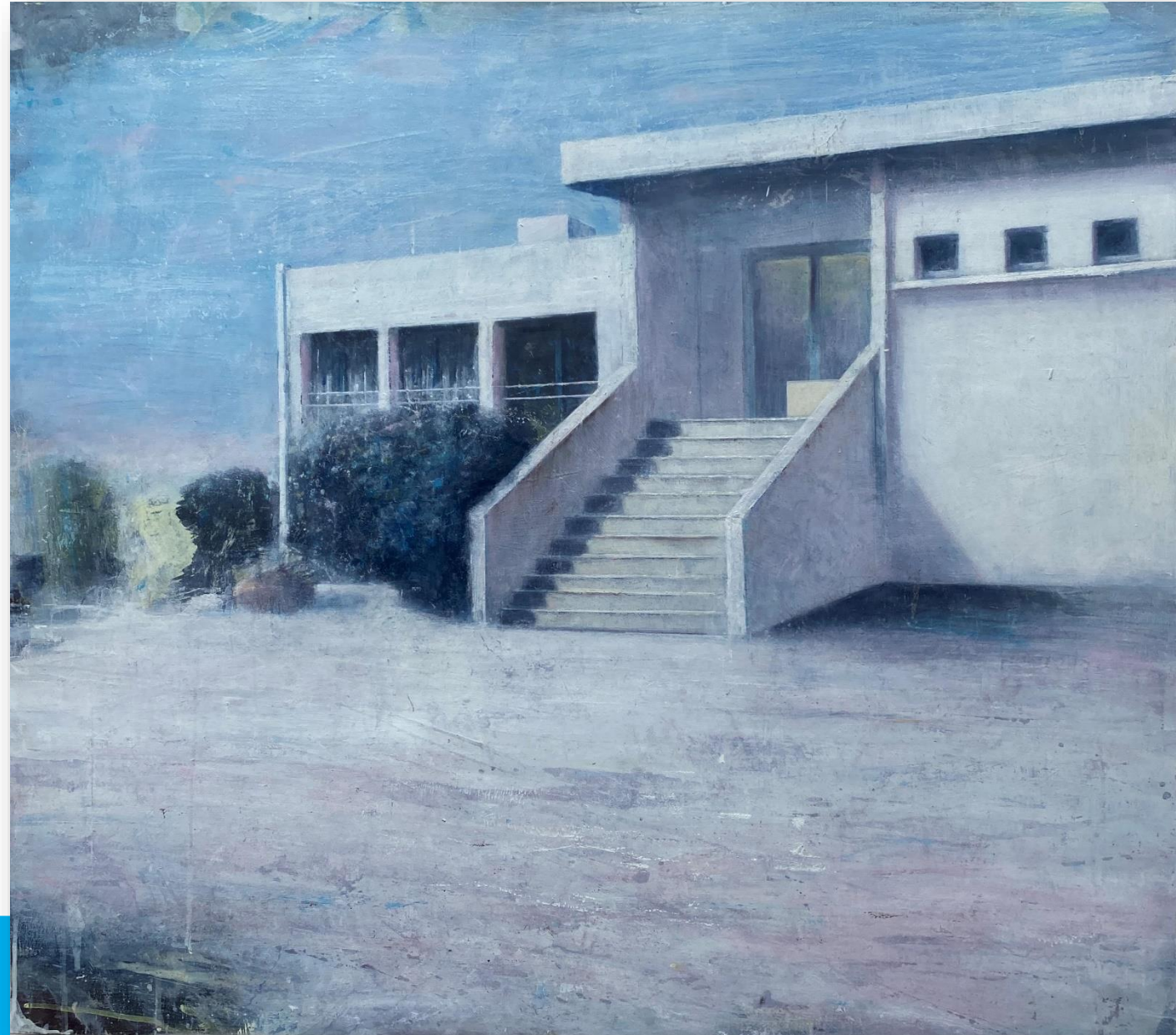
Sans titre (2021) Huile sur bois 80 x 90 cm