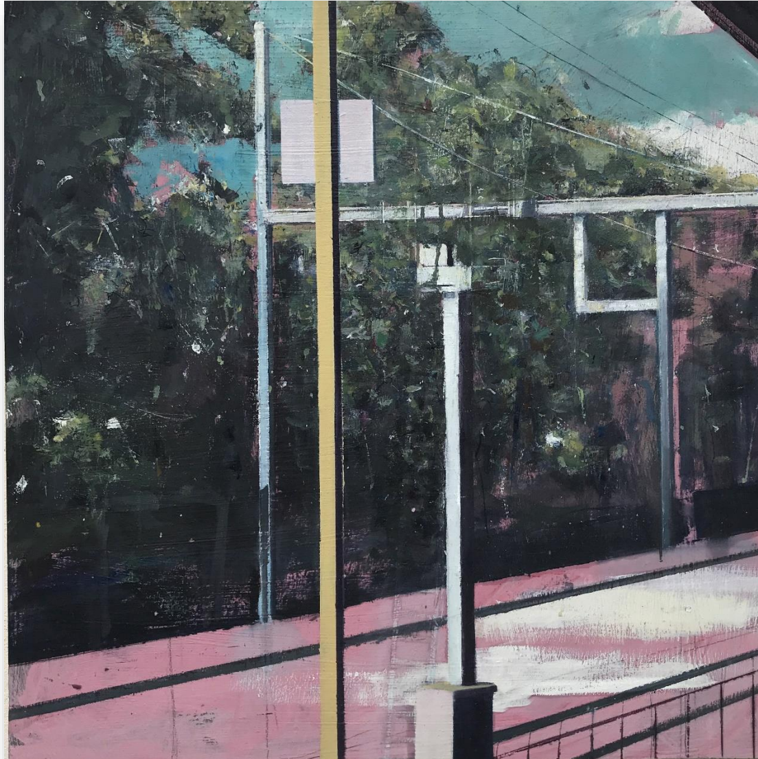
Sans titre (2021) Huile sur bois 60 x 60 cm