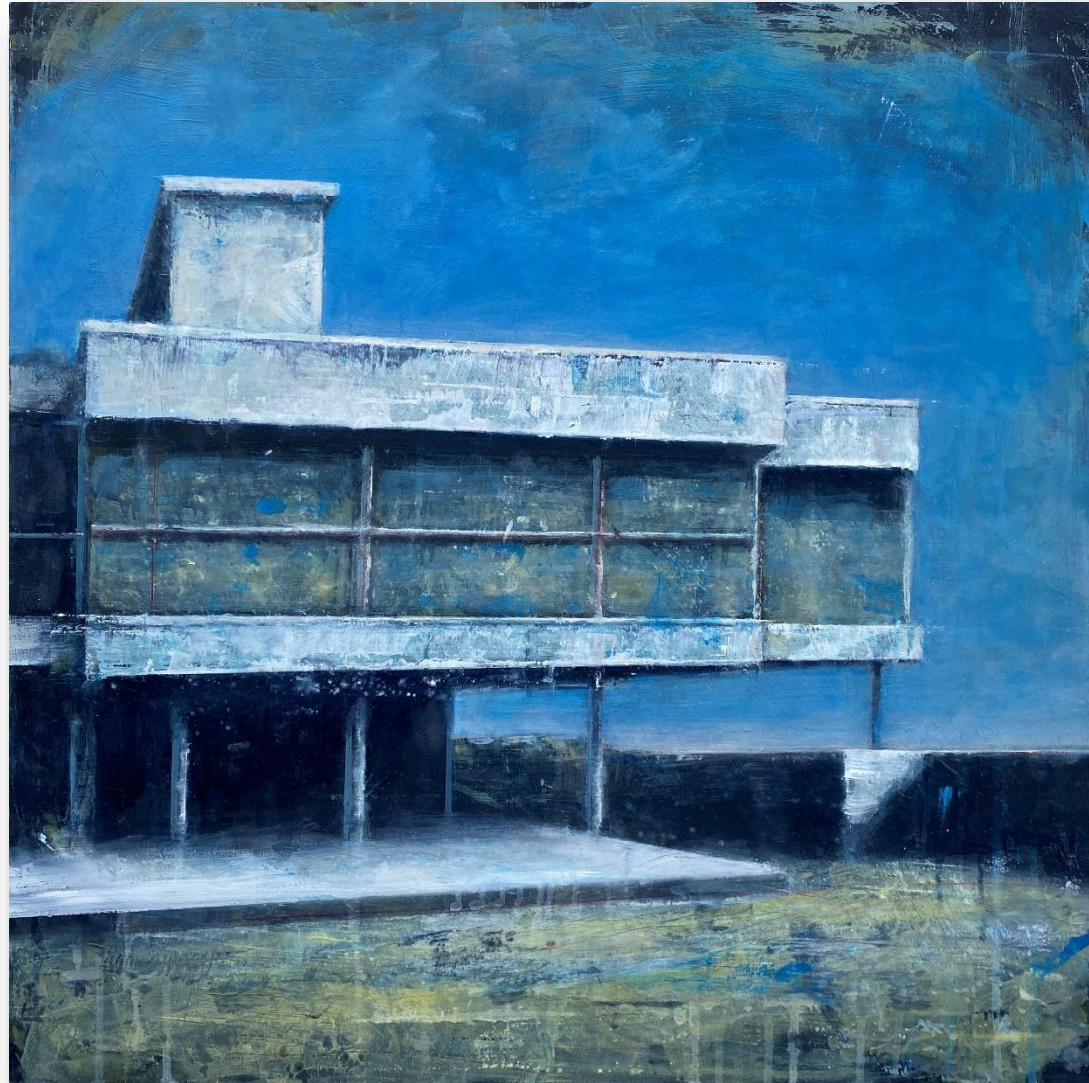
Sans titre (2021) Huile sur bois 60 x 60 cm