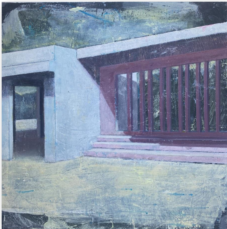
Sans titre (2021) Huile sur bois 50 x 50 cm