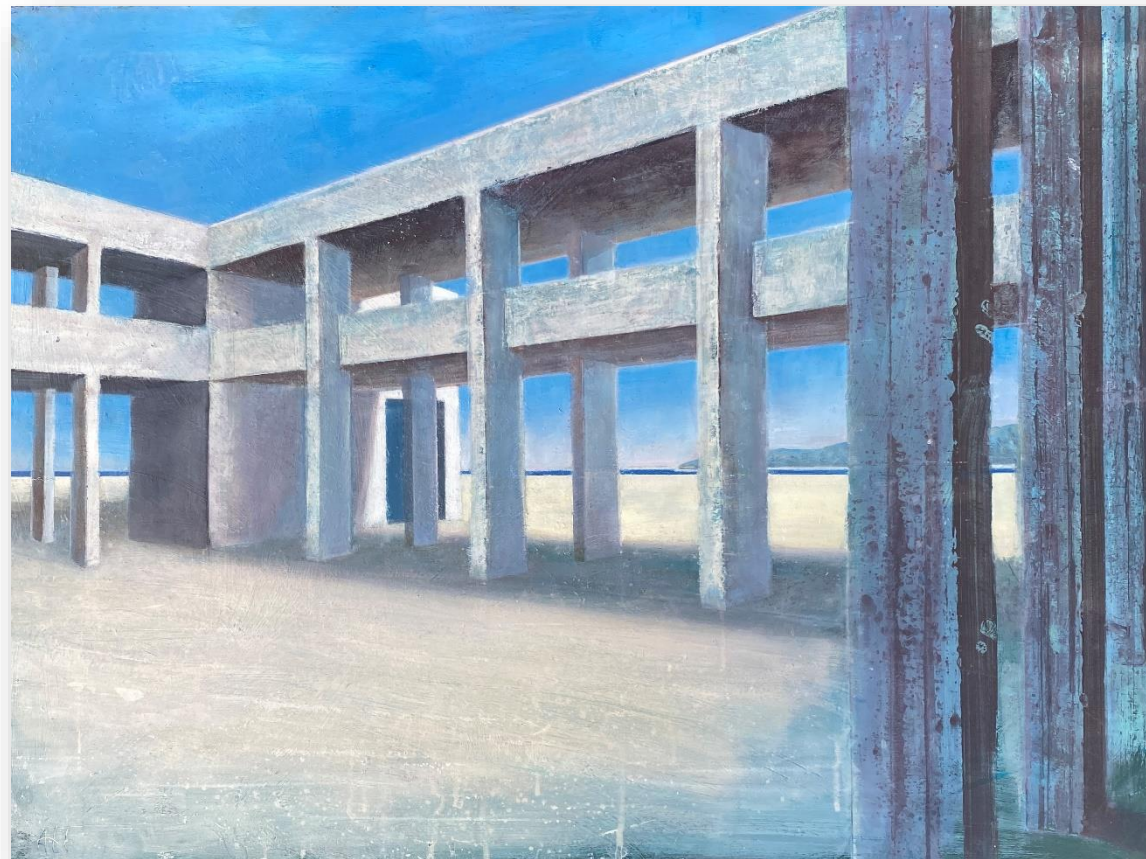
Sans titre (2021) Huile sur bois 60 x 80 cm