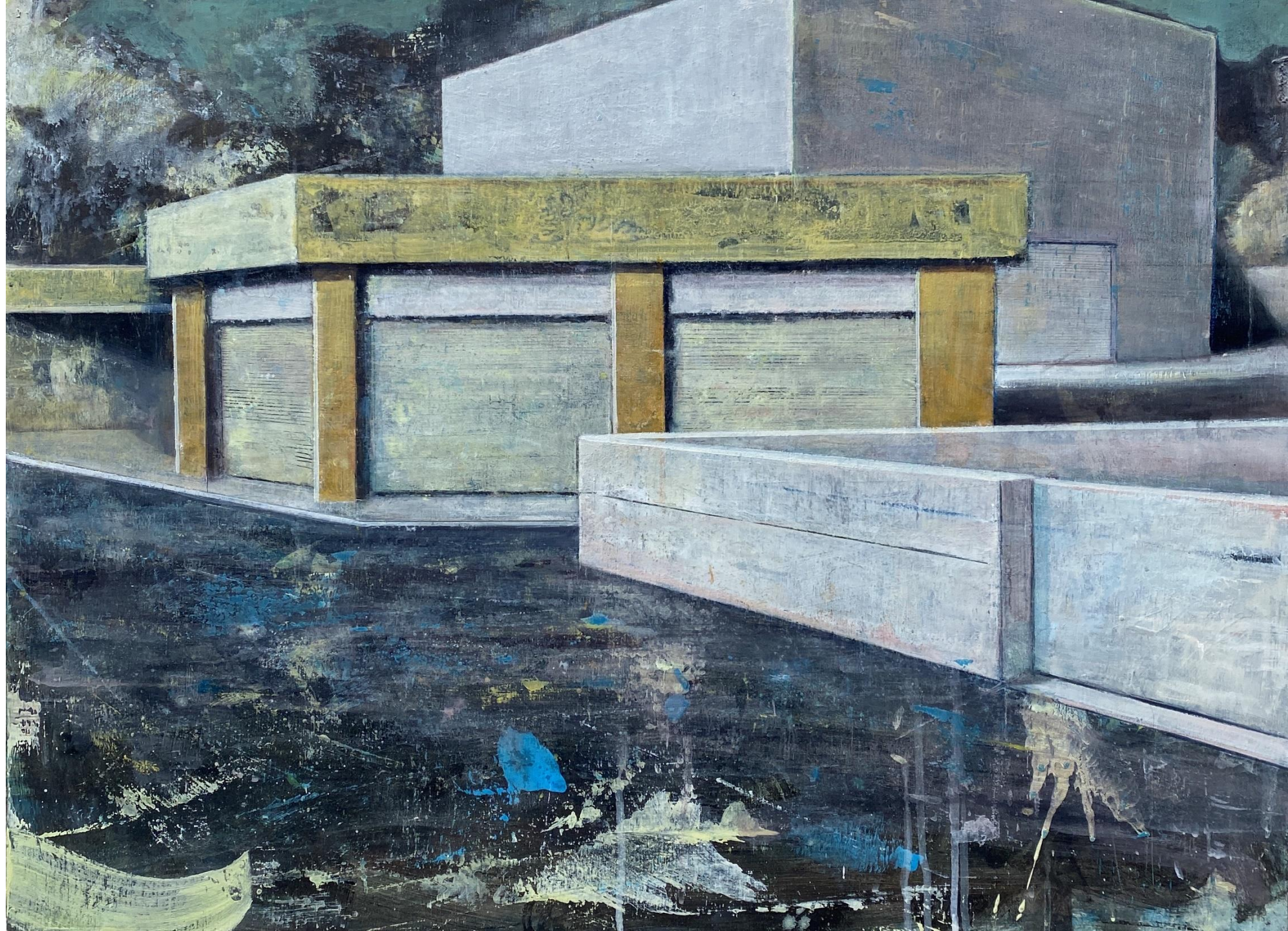
Horizon (2021) Huile sur bois 56 x 76 cm