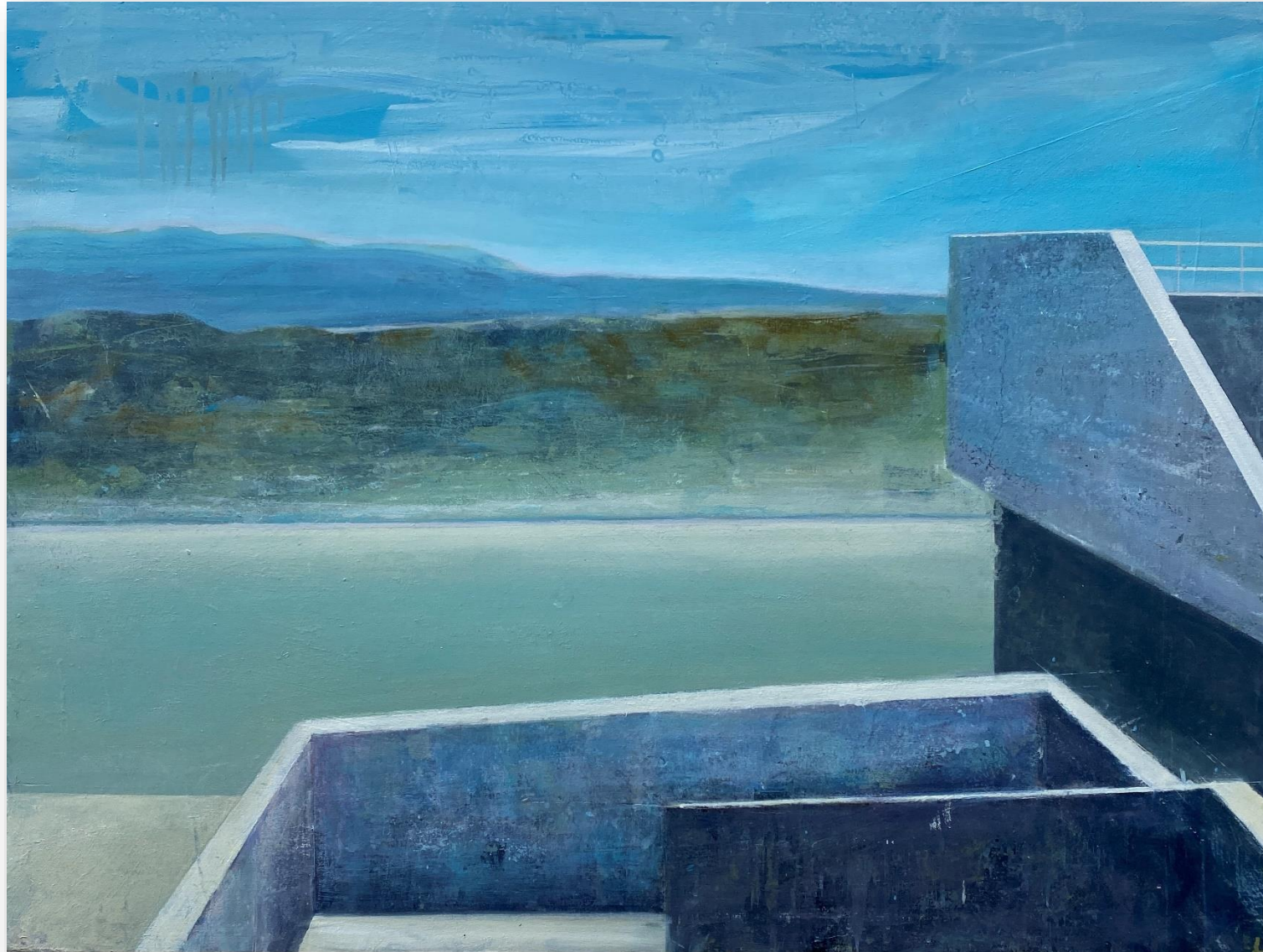
Sans titre (2021) Huile sur bois 60 x 80 cm