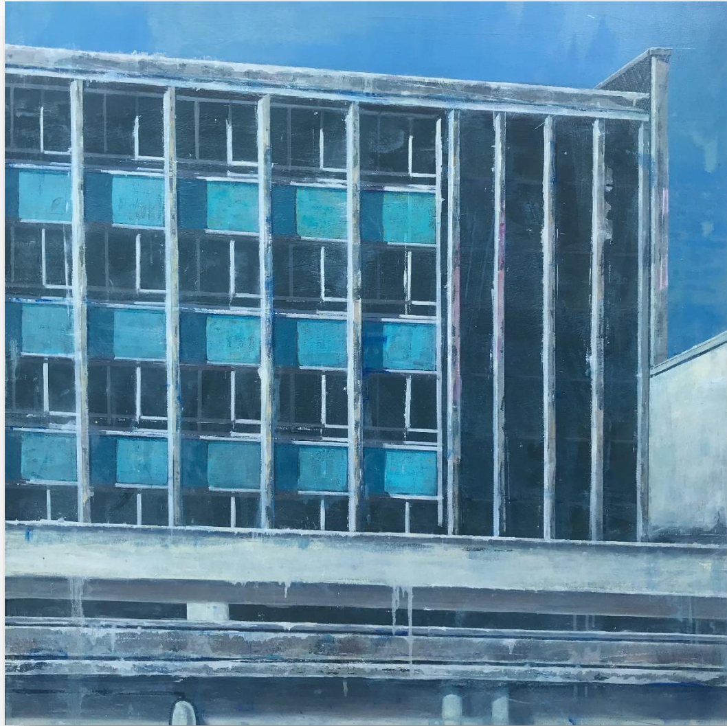
Sans titre (2021) Huile sur bois 104 x 107 cm