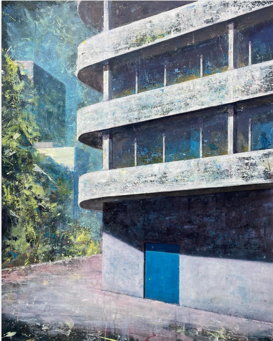
Sans titre (2021) Huile sur bois 100 x 80 cm