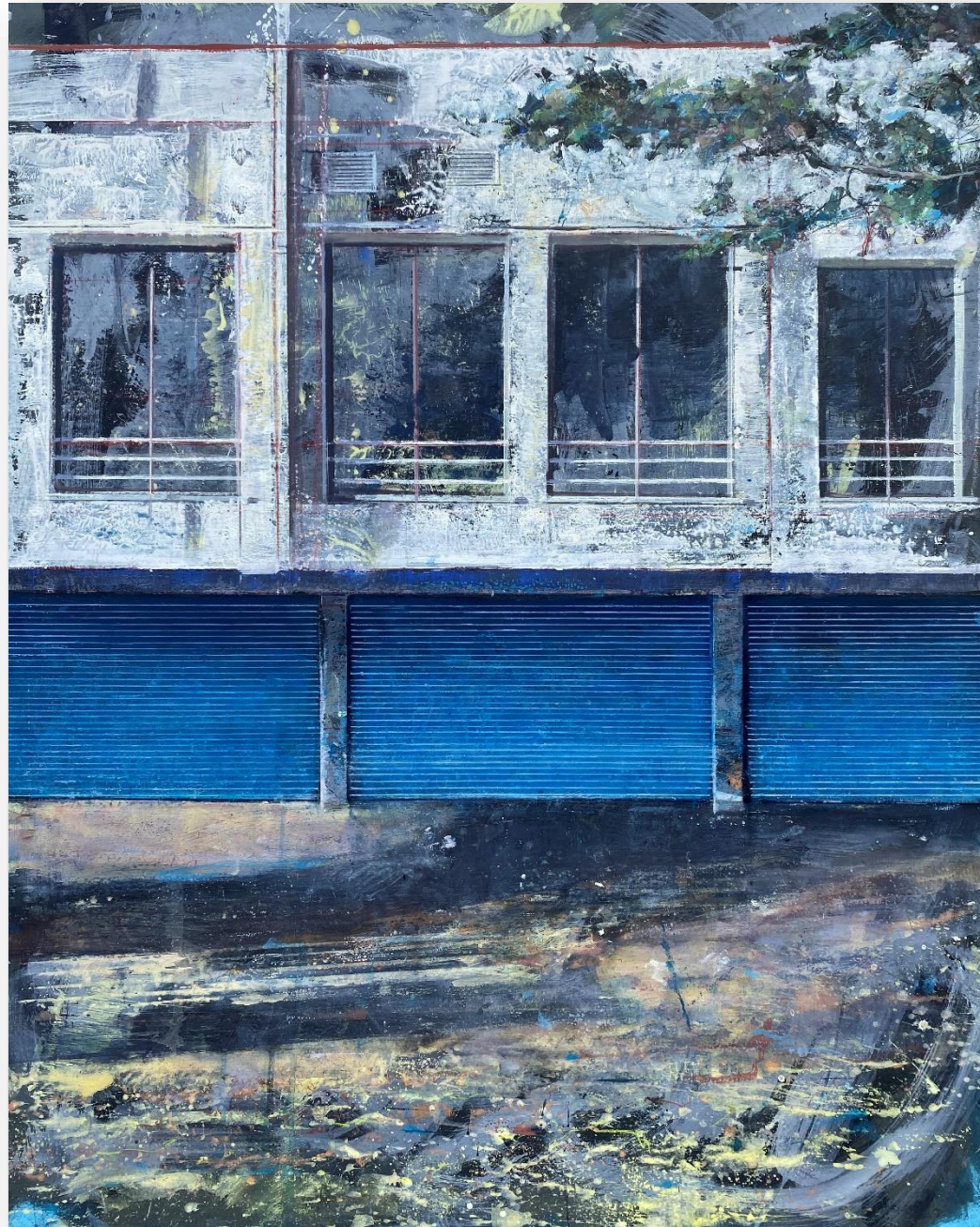
Sans titre (2021) Huile sur bois 100 x 80 cm