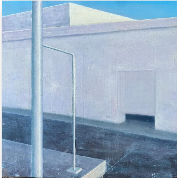
Sans titre (2021) Huile sur bois 40 x 40 cm