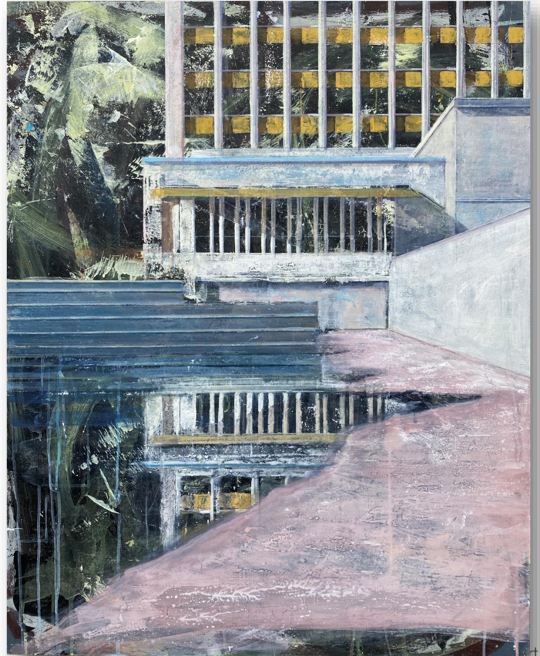
Sans titre (2021) Huile sur bois 100 x 80 cm