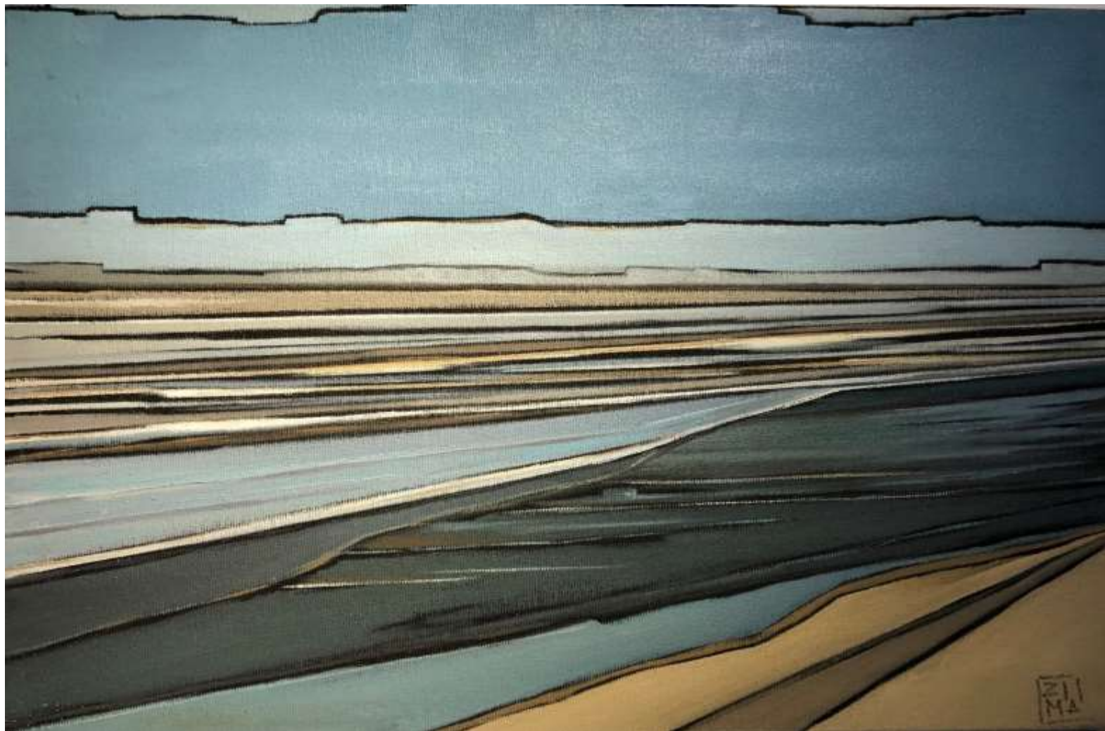
Horizon (2018) Huile sur toile 27 x 41 cm