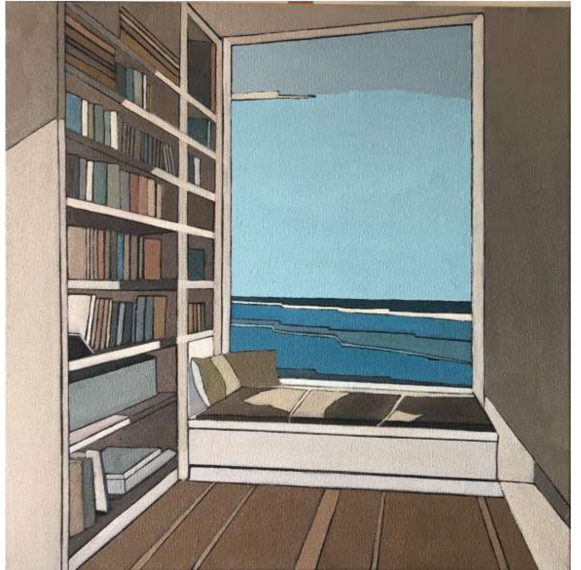
L'attente (2020) Huile sur toile 60 x 60 cm