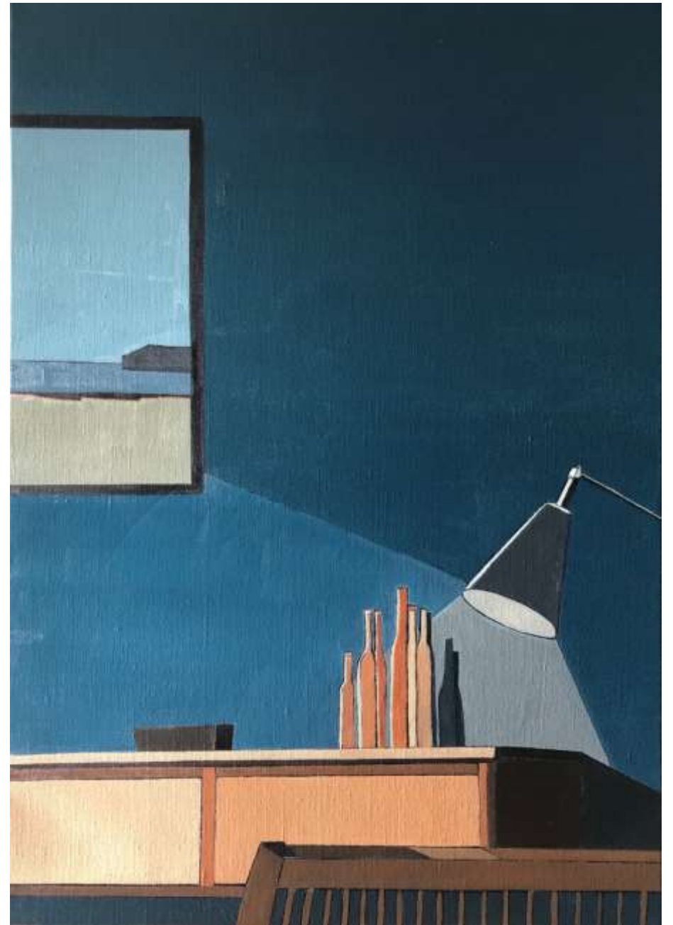
Quand tout s'arrête (2020) Huile sur toile 65 x 46 cm