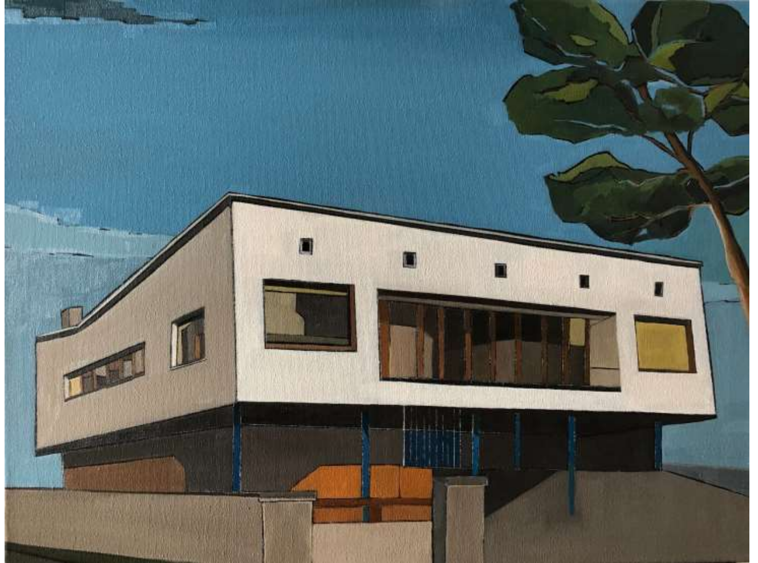
Ombre Blanche (2019) Huile sur toile 60 x 46 cm