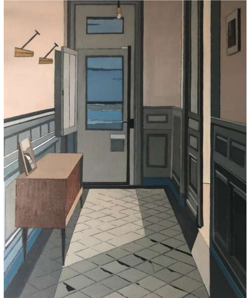
Couloir sur Mer (2020) Huile sur toile 100 x 81 cm