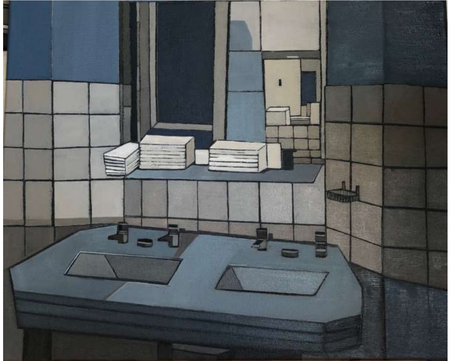
Tout en bleu (2019) Huile sur toile 40 x 50 cm