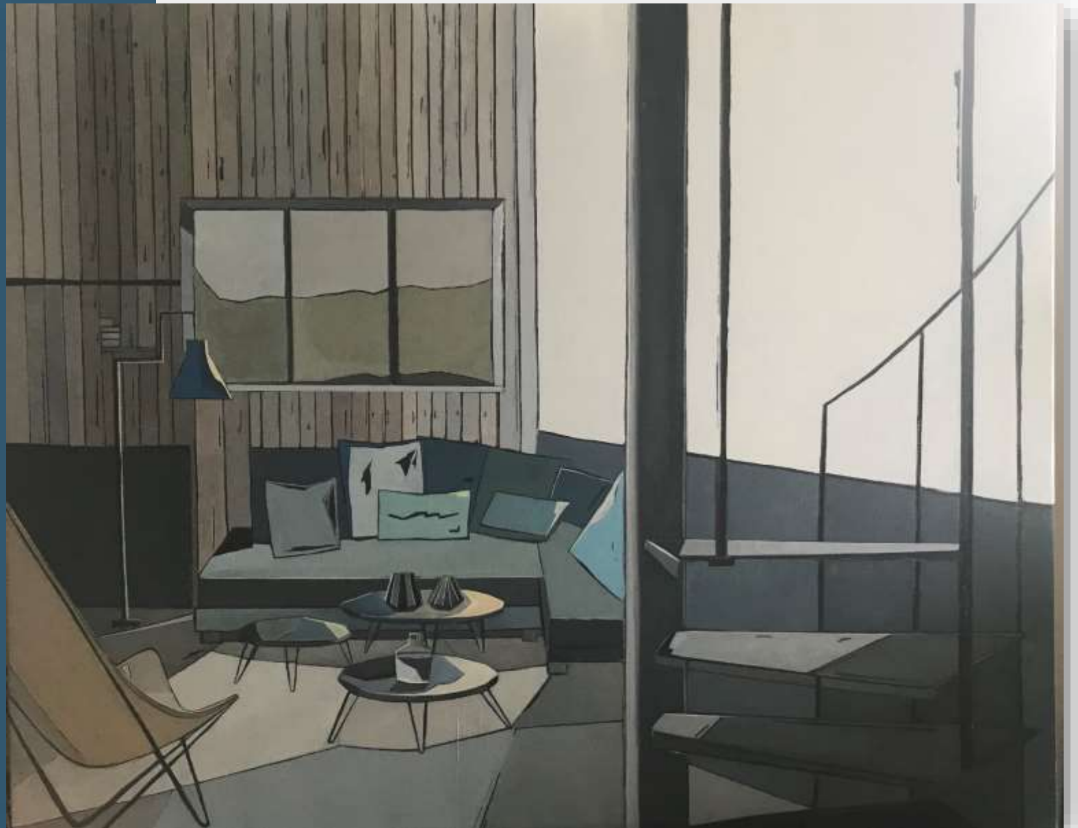
Cabane Urbaine du Cap Ferret (2018) Huile sur toile 81 x 100 cm