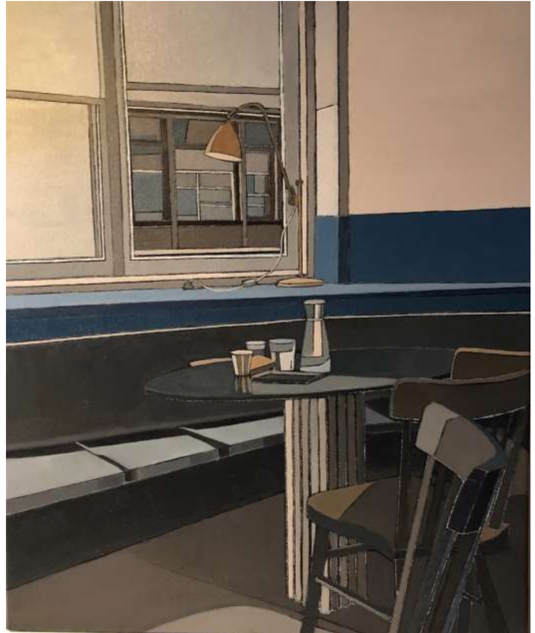
Tout est silence / Tea Time (2020) Huile sur toile 55 x 46 cm