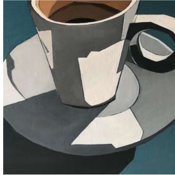
Triptyque, Café parisien (2020) Huile sur toile 107 x 40 cm