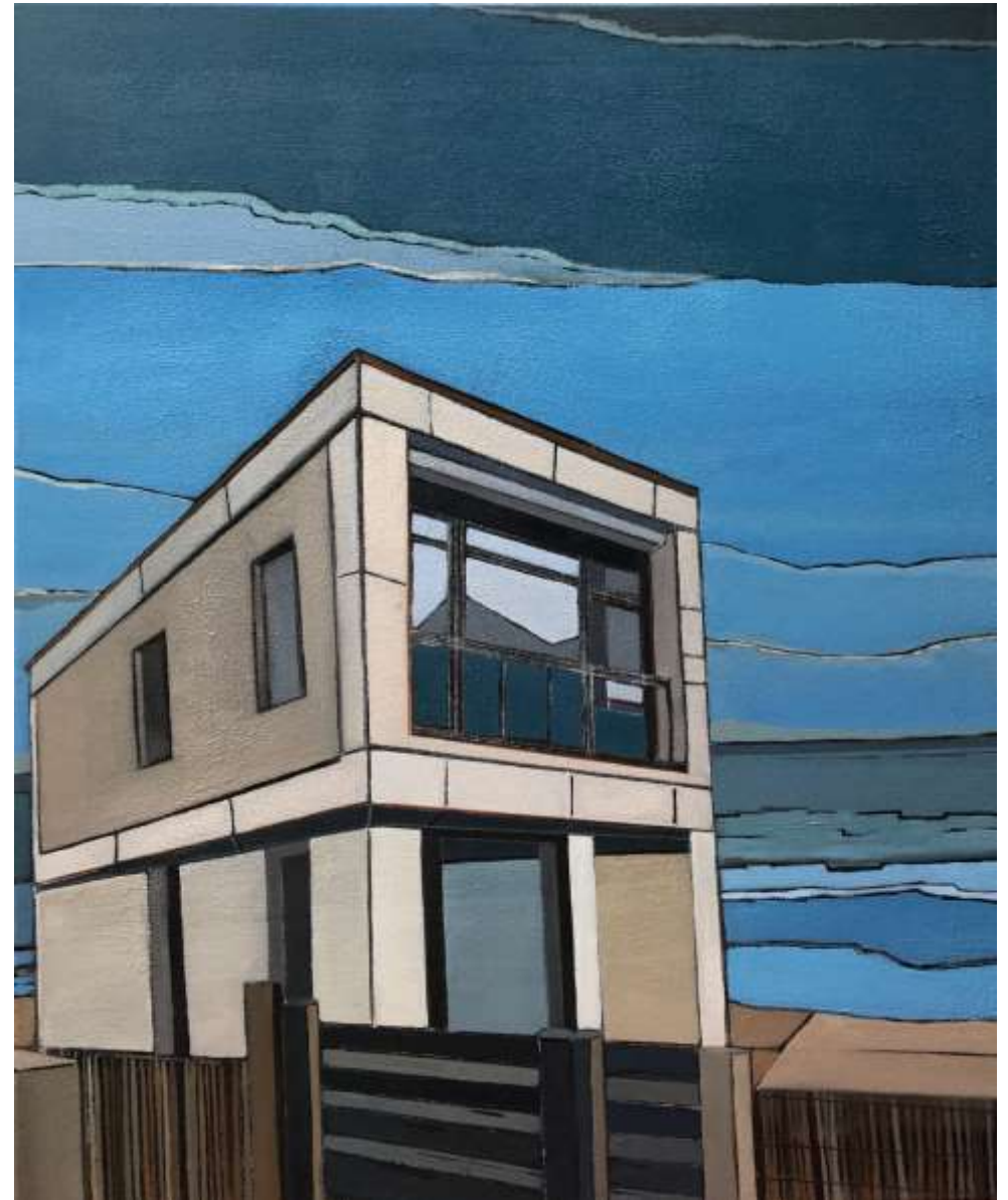
Sea Baule (2019) Huile sur toile 60 x 50 cm