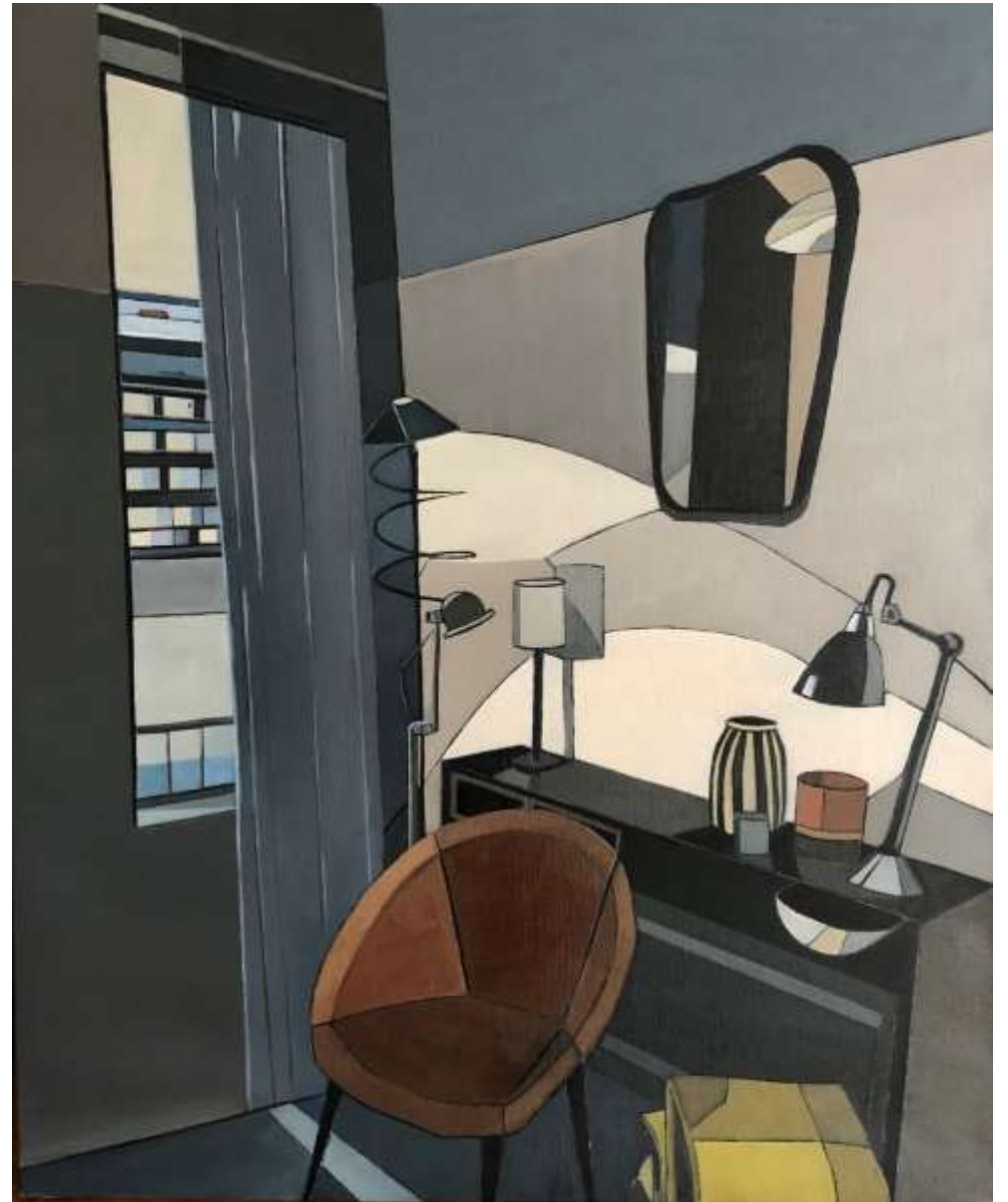
Lumière intérieure (2019) Huile sur toile 73 x 60 cm