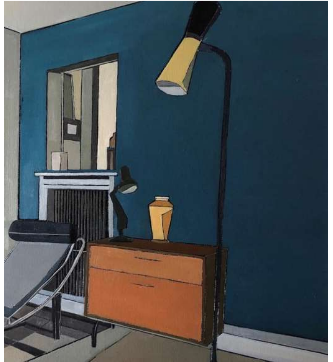
Le Repos (2019) Huile sur toile 50 x 50 cm