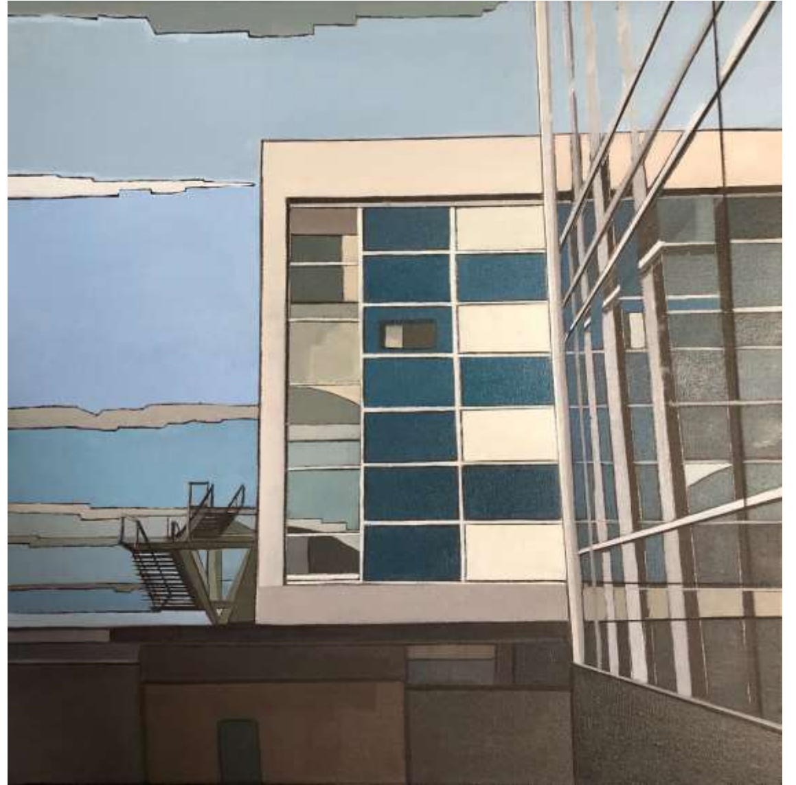
Blue (2019) Huile sur toile 50 x 50 cm